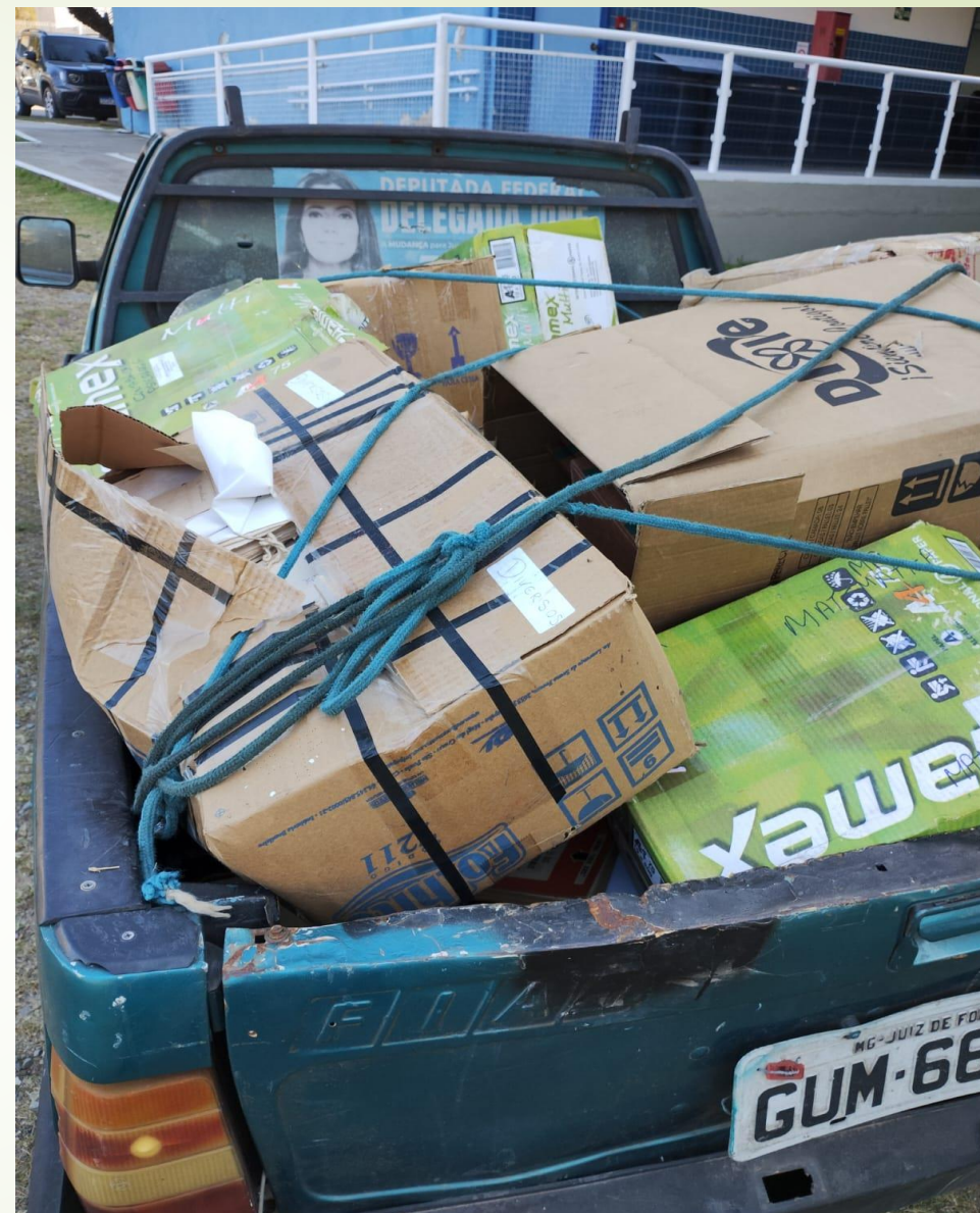
Doação do 1º/2024